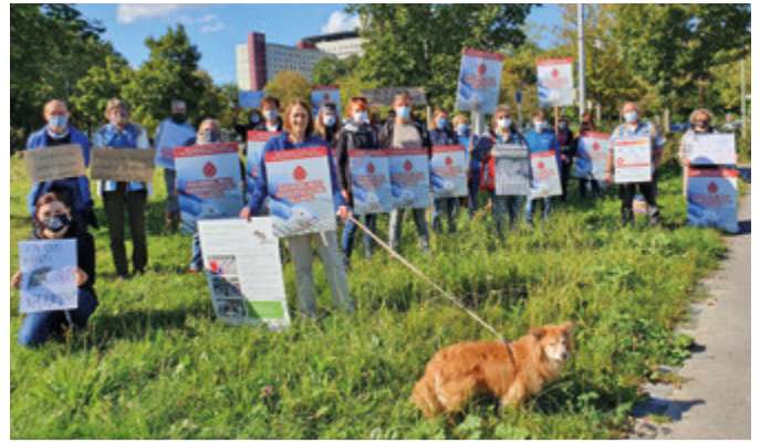
Durchhaltevermögen! Seit 1,5 Jahren protestiert die AG Augsburg regelmäßig zweimal monatlich mit Mahnwachen vor der Uniklinik und dem Sigma Park.

Unmittelbar nach Bekanntwerden des Vorhabens formulierten wir Stellungnahmen und legten unsere Argumente Entscheidungsträgern vor. Mit einer lauten, bunten Demonstration im Oktober 2020, mit seit Juli 2020 regelmäßig zwei Mal monatlich stattfindenden Mahnwachen vor der Uniklinik und dem Sigma Park, mit Plakatwerbung, Infoständen, Briefaktionen und Flash-