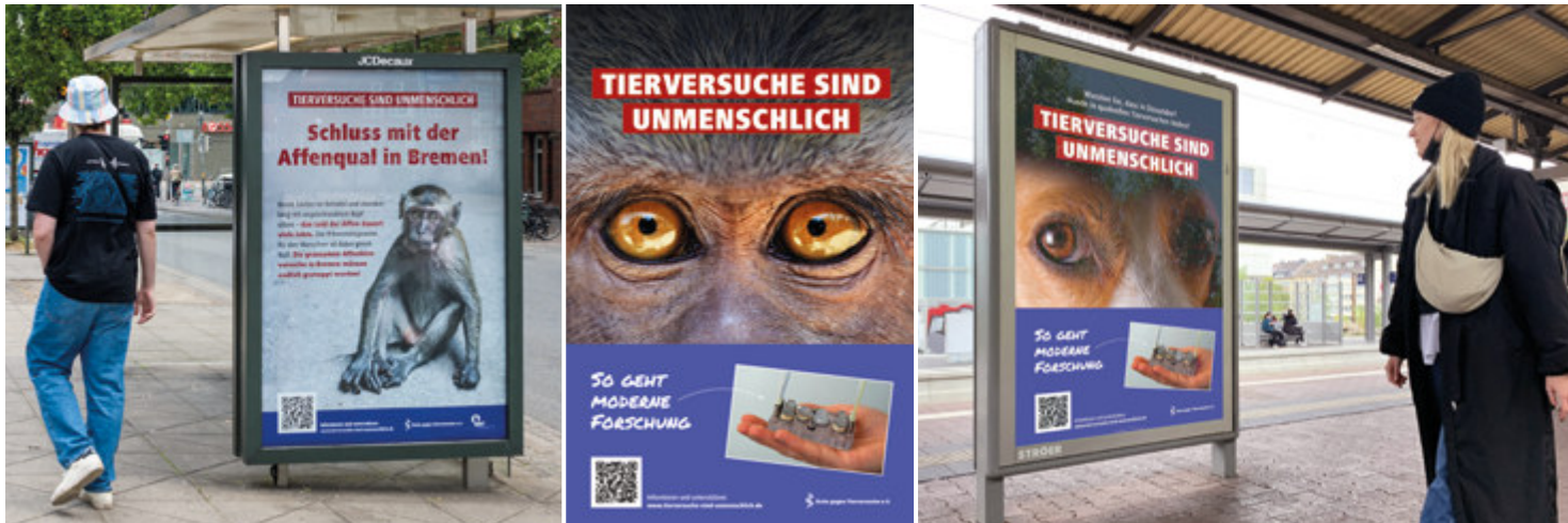
In Bremen richtete sich das Plakat gegen Affenqual.

Wenn die Menschen wüssten, was Tieren in Versuchslaboren angetan wird, wie grausam und folgenschwer diese Versuche sind und wie leistungsstark die tierversuchsfreie Forschung, dann würde der Druck auf Politik und Forschung deutlich steigen, endlich wirksame Maßnahmen gegen Tierversuche einzuleiten. Deshalb starteten wir eine neue Runde unserer Öffentlichkeitskampagne mit dem Slogan: „Tierversuche sind unmenschlich“!