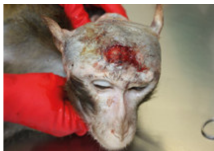
Affe Jara: Frischer Hautdefekt, mangelhafte Defektdeckung, unprofessionelle Hautnaht.

Unter www.affenleid.aerzte-gegen-tierversuche.de finden Sie unsere neue Online-Petition, Musterbriefe sowie umfangreiche Informationen zum Thema.