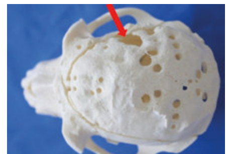
Hochgradige Osteoporose des Schädelknochens und Schädelfraktur (roter Pfeil).

Es ist unfassbar, wie derart schweres Leid gepaart mit Verstößen gegen das Tierschutzgesetz bis in die obersten politischen Gremien in Abrede gestellt oder verschwiegen wird.