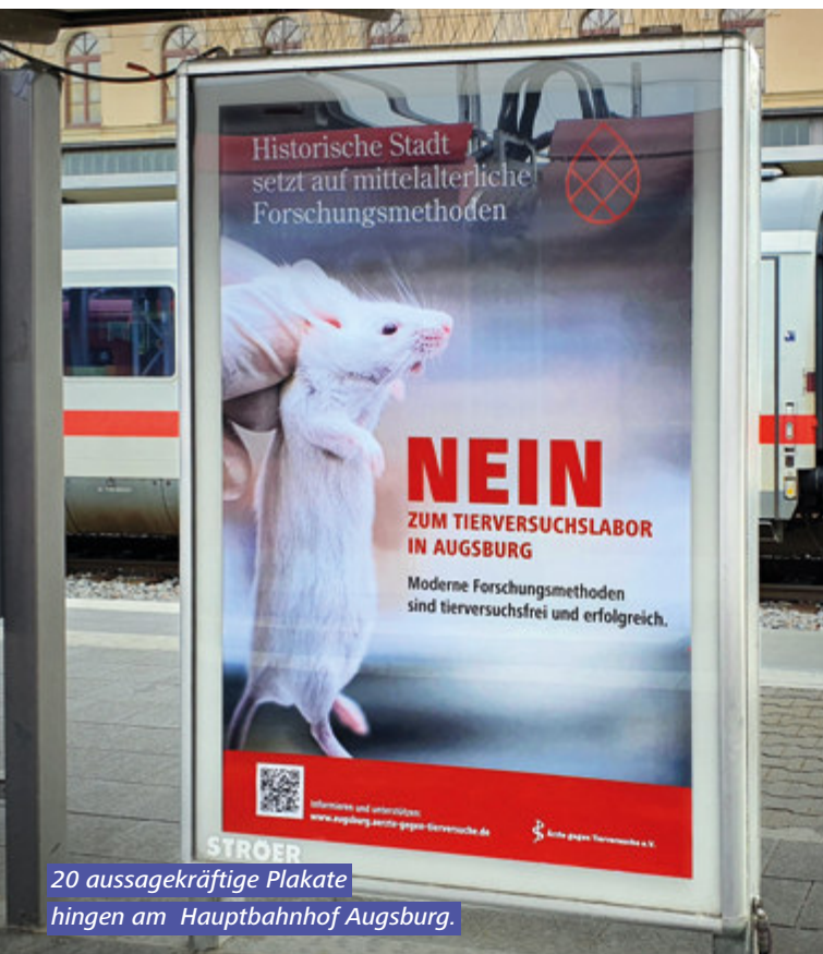
20 aussagekräftige Plakate hingen am Hauptbahnhof Augsburg.

■ Details auf unserer Kampagnen-Webseite www.tierversuche-sind-unmenschlich.de